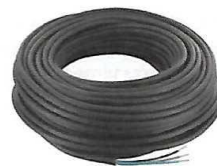
Câble électrique triple