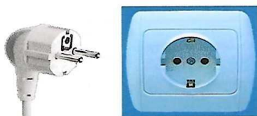
Prise avec terre