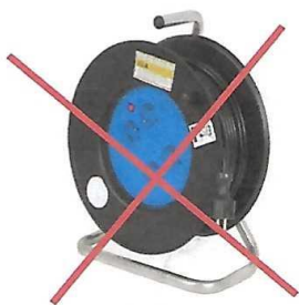
Enrouleur ou prolongateur