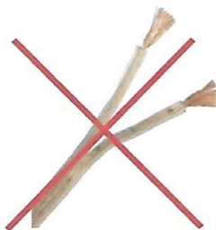
Câble électrique type scindex